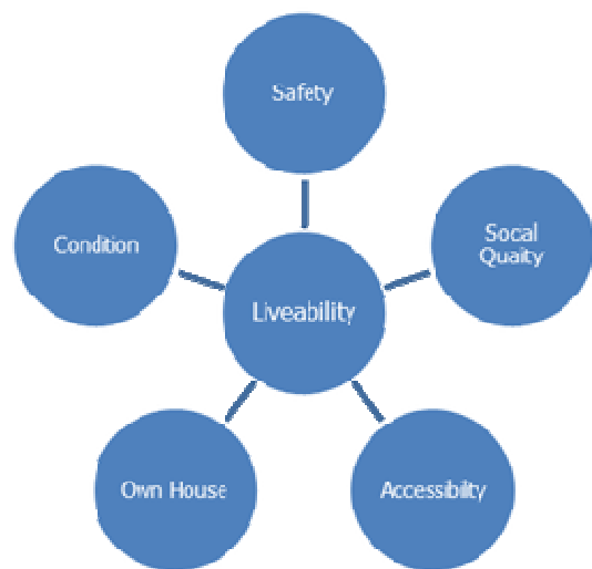
Figuur 2: Leefbaarheidskenmerken

Om de hoofdvraag te kunnen beantwoorden is eerst onderzocht wat de termen leefbaarheid en bereikbaarheid in deze context eigenlijk betekenen en hoe ze geoperationaliseerd kunnen worden. Daartoe is een literatuurstudie gedaan naar beide termen. Onder andere door Robert Cervero en Ruut Veenhoven zijn uitgebreide studies gedaan naar de onderwerpen leefbaarheid en bereikbaarheid. Uit de literatuurstudie is gebleken dat leefbaarheid een zeer breed gebruikte term is met veel betekenissen. Leefbaarheid heeft vele facetten en kan op vele schaalniveaus en op verschillende tijdstippen onderzocht worden,