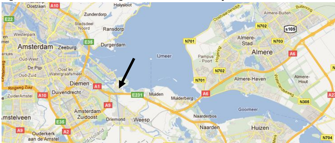
Figuur 1: Locatie Muiderbrug A1 over Amsterdam-Rijnkanaal

De brug vormt een belangrijke schakel in de netwerken van zowel auto, bus als fiets tussen het Gooi en Almere enerzijds en Amsterdam anderzijds. In de verre omtrek zijn geen andere kanaalkruisingen te vinden. De dichtstbijzijnde is enkele kilometers zuidelijker, de spoorbrug Weesp, met een zeer smal fietspad maar geen mogelijkheid voor auto of bus. Aan de noordkant moet je kilometers om door de woonwijk IJburg. De bussen van Almere en het Gooi naar Amsterdam, zo'n 40 per uur, 554 per etmaal, gebruiken de parallelweg. Op de verbinding neemt het verkeer gestaag toe. Almere groeit, nieuwe woonwijken zijn gepland direct ten oosten van de brug. Ook het Amsterdamse recreatieverkeer richting het Gooi neemt nog steeds toe. Bovendien is Rijkswaterstaat Noord-Holland groot-onderhoud aan de brug aan het voorbereiden. Tijdens die werkzaamheden zal de parallelweg verder onder druk komen te staan en stijgt de vloedgolf van sluipverkeer waar geen slagboom tegen bestand blijkt. Kortom: de inrichting van de parallelweg is niet langer toegerust op de almaar toegenomen verkeersdruk. Een weeffout in het netwerk vanuit een ver verleden.