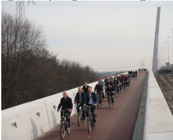
Figuur 4: Opening Muiderfietsbrug