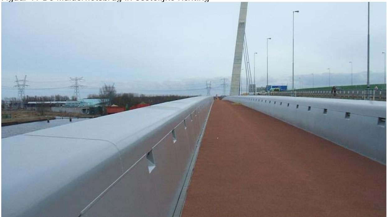
Figuur 7: De Muiderfietsbrug in oostelijke richting

Als iedereen over de brug komt, dan komt de brug er ook.