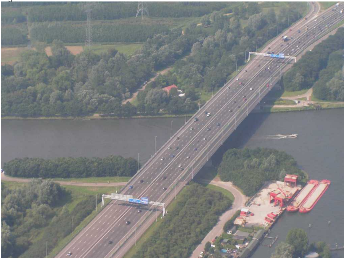
Figuur 2: Bestaande situatie 2003

Wat is logischer dan tegelijk met het groot onderhoud in één keer het knelpunt op de parallelweg– zo nodig tegen beperkte meerkosten - op te lossen?