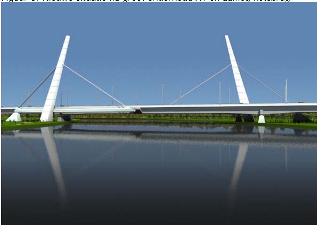
Figuur 6: Nieuwe situatie na groot onderhoud A1 én aanleg fietsbrug

In de tussentijd zijn ook de toeleidende routes en het onoverzichtelijke kruispunt bij de toegangsweg tot de Maxis aangepakt door de gemeente Muiden en de provincie Noord-Holland. Hiermee is het hele werk voltooid en sprake van een duurzaam veilige oplossing. De weeffout uit het verleden is eindelijk hersteld.