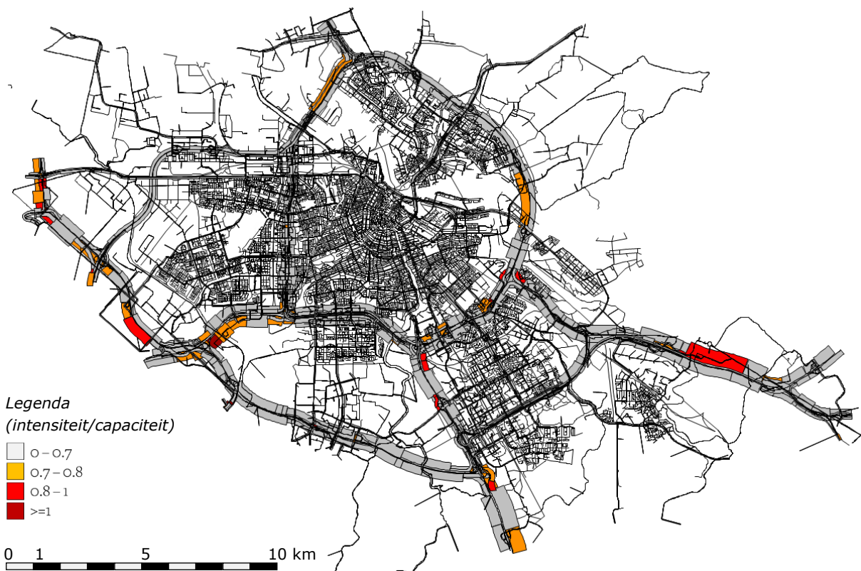
Figuur 3: Mate van congestie in de ochtendspits in Amsterdam in scenario 2: 'Geringe veranderingen'.