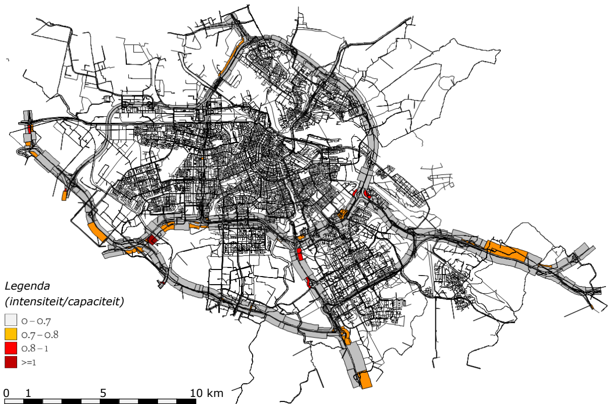
Figuur 4: Mate van congestie in de ochtendspits in Amsterdam in scenario 3: 'Thuiswerken is een blijvertje'.