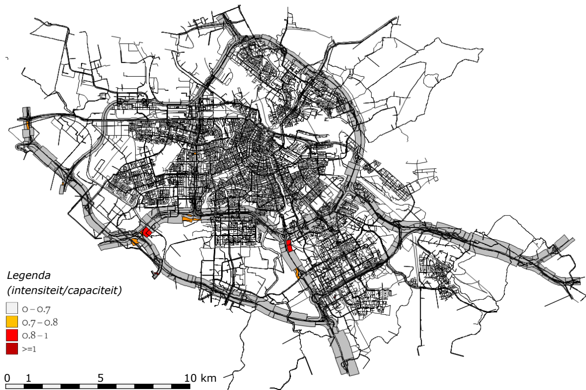
Figuur 5: Mate van congestie in de ochtendspits in Amsterdam in scenario 4: 'Het fietsparadijs'.